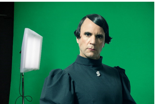
Bjørn Melhus Setfoto, Freedom & Independence 2014 © VG Bild-Kunst, Bonn 2019