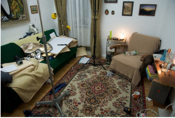
Bjørn Melhus Setfoto, I'm Not The Enemy 2011 © VG Bild-Kunst, Bonn 2019