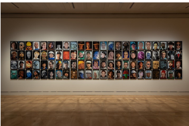
Ausstellungsansicht im Atelier Liebermann: Bjørn Melhus. HOT SET 2019