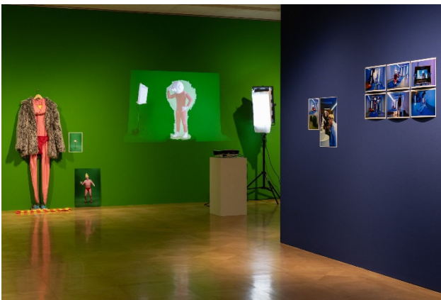
Ausstellungsansicht im Atelier Liebermann: Bjørn Melhus. HOT SET 2019

Pressekontakt Natascha Driever Referentin Marketing und Kommunikation Telefon: 030 226330-19 Telefax: 030 226330-14 natascha.driever @stiftungbrandenburgertor.de www.stiftungbrandenburgertor.de