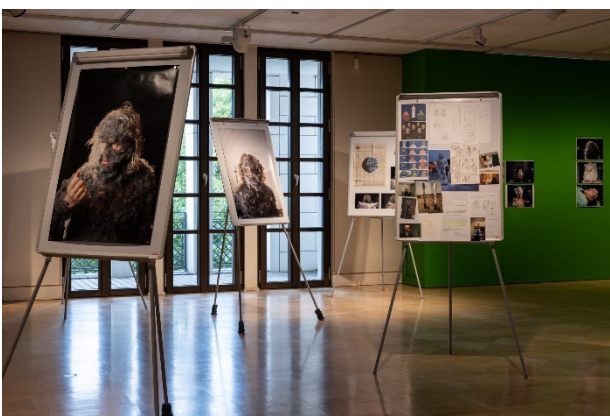
Ausstellungsansicht im Atelier Liebermann: Bjørn Melhus. HOT SET 2019