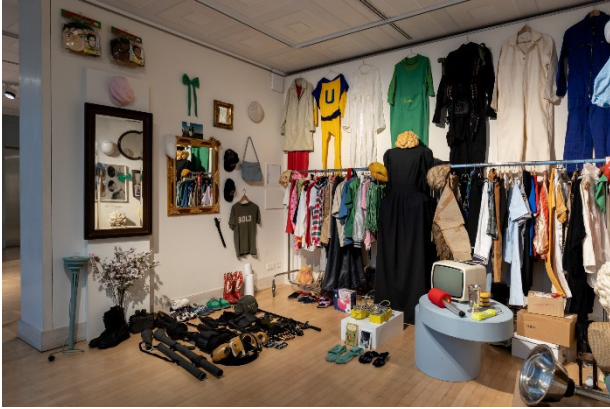
Ausstellungsansicht im Atelier Liebermann: Bjørn Melhus. HOT SET 2019