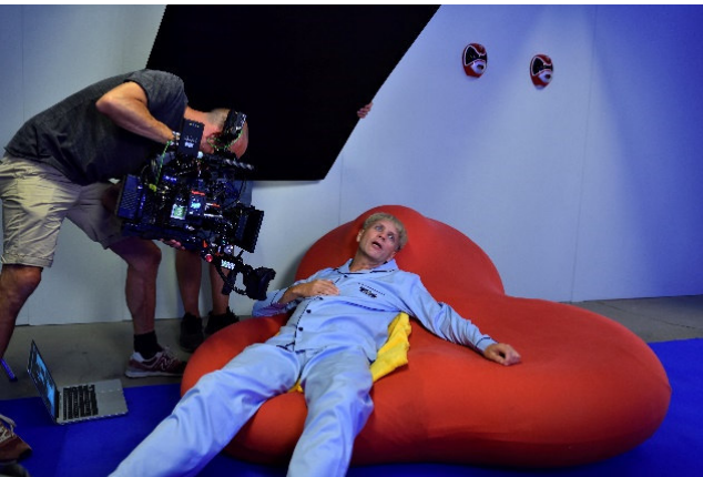
Bjørn Melhus Setfoto, Sugar 2019 © VG Bild-Kunst, Bonn 2019 Foto: Ralf Henning