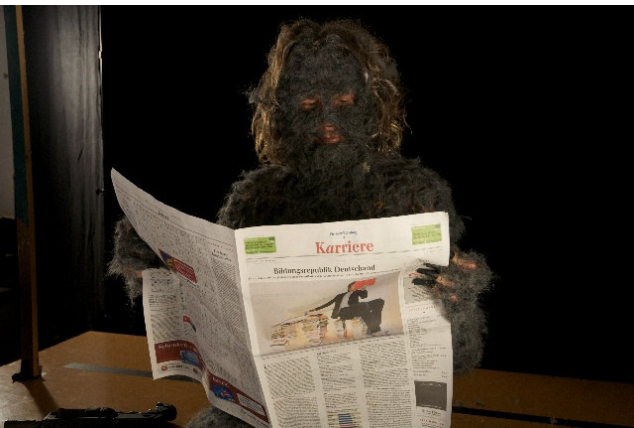
Bjørn Melhus Setfoto, I Do Not Belong in This House 2011 © VG Bild-Kunst, Bonn 2019