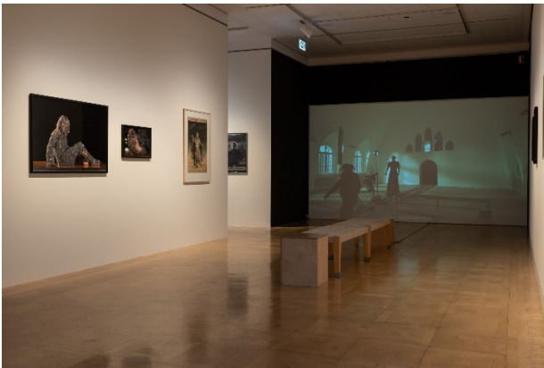
Ausstellungsansicht im Atelier Liebermann: Bjørn Melhus. HOT SET 2019