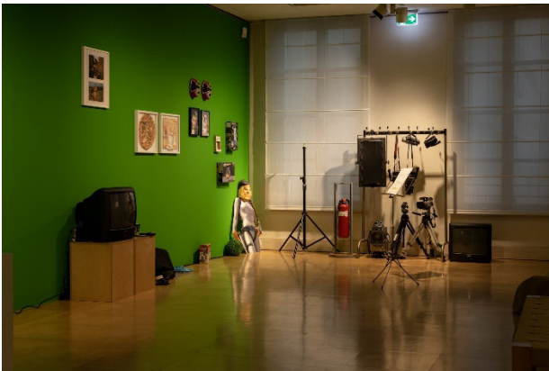
Ausstellungsansicht im Atelier Liebermann: Bjørn Melhus. HOT SET 2019